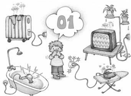
Пример демонстрационного материала из комплекта карточек «Пожарная безопасность» (см. Приложение 1).

Парциальная образовательная программа «Мир Без Опасности» разработана в соответствии с требованиями Федерального государственного образовательного стандарта дошкольного образования (Приказ Минобрнауки России № 1155 от 17.10.2013) и согласована с Федеральным законом «Об обра-