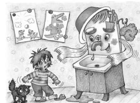
Пример демонстрационного материала из комплекта карточек «Что такое хорошо и что такое плохо».

III. Организационный раздел раскрывает: 1) основные подходы к организации образовательной деятельности в дошкольной образовательной организации; 2) рекомендации по адаптации парциальной программы «Мир Без Опасности» к запросу особого ребенка; 3) особенности взаимодействия педагогического коллектива с семьями воспитанников; 4) примерный перечень материалов и оборудования для создания развивающей предметно-пространственной среды; 5) список учебно-методических и наглядно-дидактических пособий, рекомендуемых для успешной реализации парциальной образовательной программы «Мир Без Опасности».