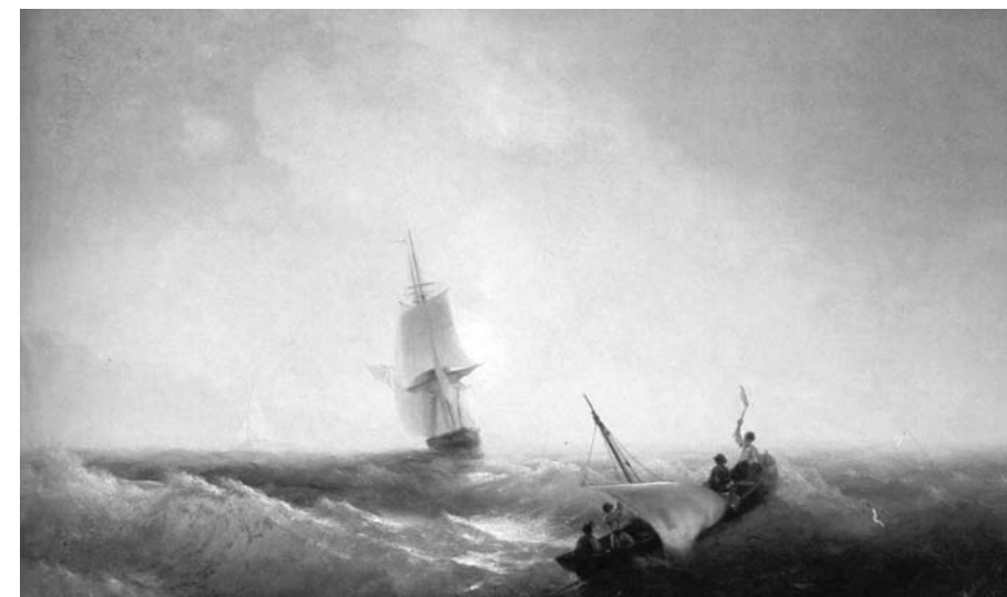
Айвазовский И. Спасаящиеся от кораблекрушения. 1844.

Кораблю безопасней в порту, но он не для этого строился. Грейс Хоппер